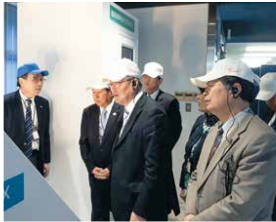
東北シャノン(株)／北湯口