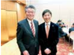
金メダリスト萩原健司氏と

胡四王蘇民祭 花巻商工会議所新年交賀会 東和地域新年交賀会 大迫地域新年交賀会 花巻市成人式 花巻市消防出初式 花巻青年会議所賀詞交歓会 スポーツ振興議員連盟講演会