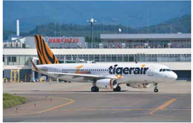
定期チャーター便として就航しているタイガーエア

この結果、チャーター便の誘致、また外国人宿泊者についても過去最高を記録しており、今後にも必要に応じて、海外の旅行会社の意見を聞きながら強化についても検討していく。