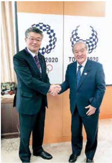
鈴木オリンピック担当大臣／総務省