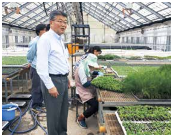
プロ農夢花巻／太田