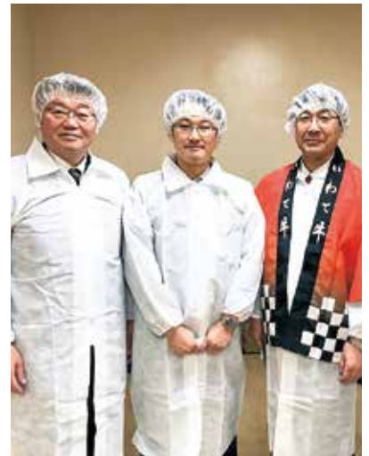
いわて牛枝肉共励会／東京中央卸売市場