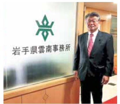
岩手県雲南事務所／中国