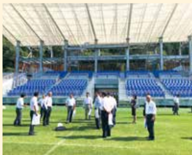
釜石鶴住居復興スタジアム