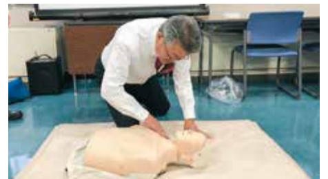
防災士資格を取得