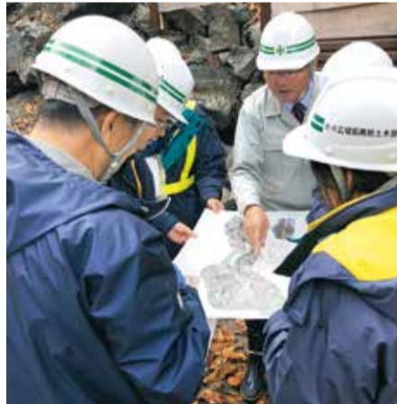
県道花巻大曲線なめところラインの土砂崩落現場を調査