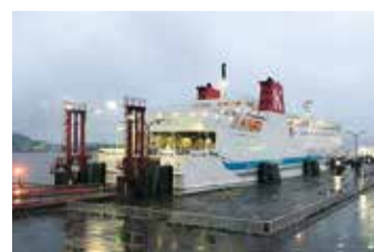
宮古・室蘭間フェリー

本県は、これまでも北海道との相互交流の拡大、首都圏や海外をターゲットとした、北海道と本県を大きく北日本広域という形で周遊するルートの売り込みなどに取り組みしているところであり、今後も宮古・室蘭間フェリーや北海道新幹線等の新たな交通ネットワークも活用し、北海道と連携しながら日本全体また本県の誘客拡大に繋がる取り組みをしていく。