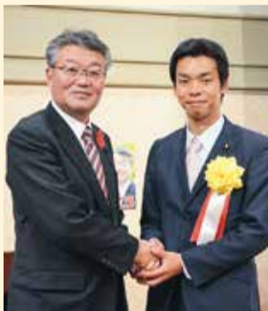
井野俊郎衆議院議員と