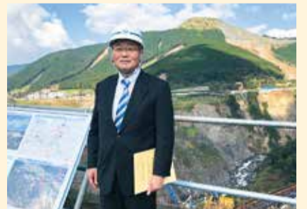
総務委員会県外調査(熊本県)