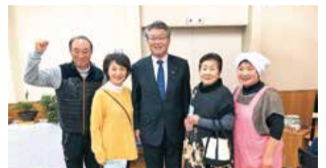
石神町文化祭にお邪魔しました。