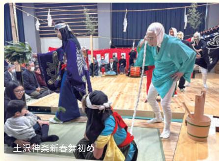
土沢神楽新春舞初め