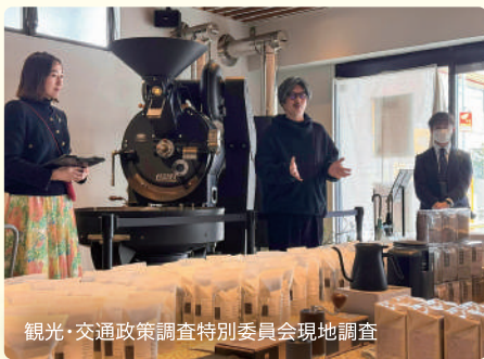
観光・交通政策調査特別委員会現地調査