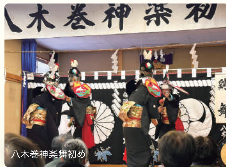
八木巻神楽舞初め