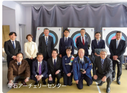
雫石アーチェリーセンター