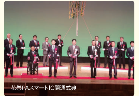
花巻PAスマートIC開通式典