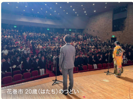
花巻市 20歳(はたち)のつどい