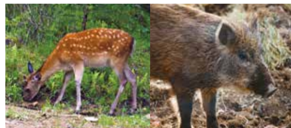
シカ・イノシシの被害が増えている